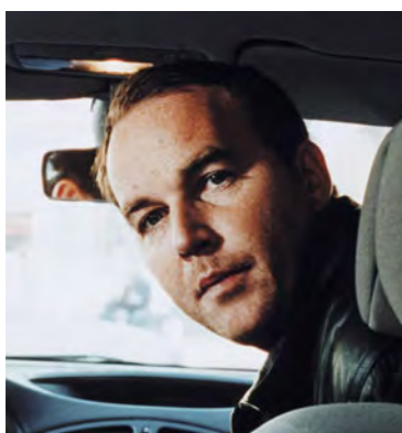
Xavier Beauvois