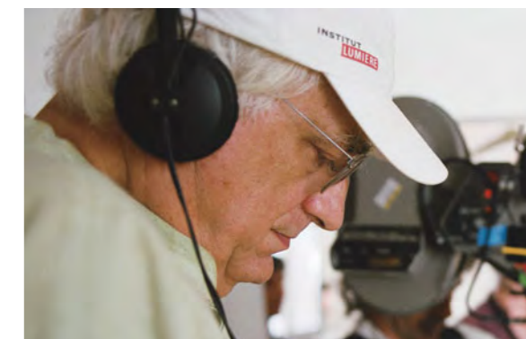
Bertrand Tavernier