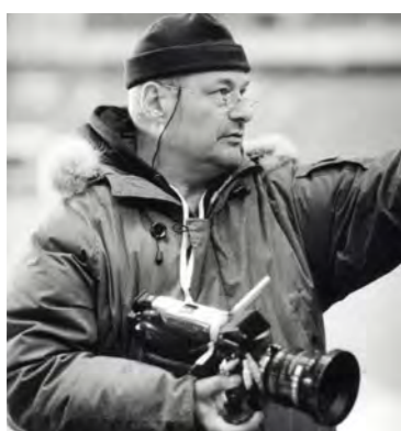
Jean-Pierre Jeunet