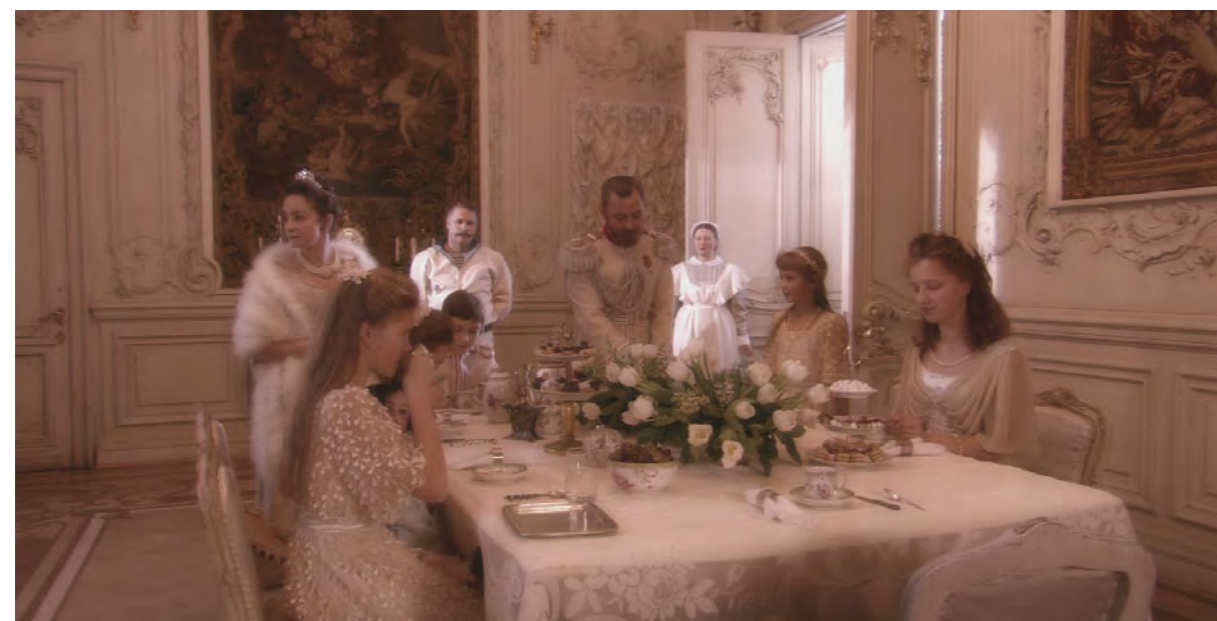
L'Arche russe

Trois ciné-concerts, avec des films muets de la grande période soviétique (29 septembre, 1 er et 9 octobre) ; un week-end entier sur deux événements qui ont bouleversé la Russie, la révolution de 1917 et la Seconde Guerre mondiale (25 et 26 septembre) ; un coup de projecteur sur le réalisateur Marlen Khoutsiev, né en 1925 et violemment attaqué par Khrouchtchev (29 septembre).