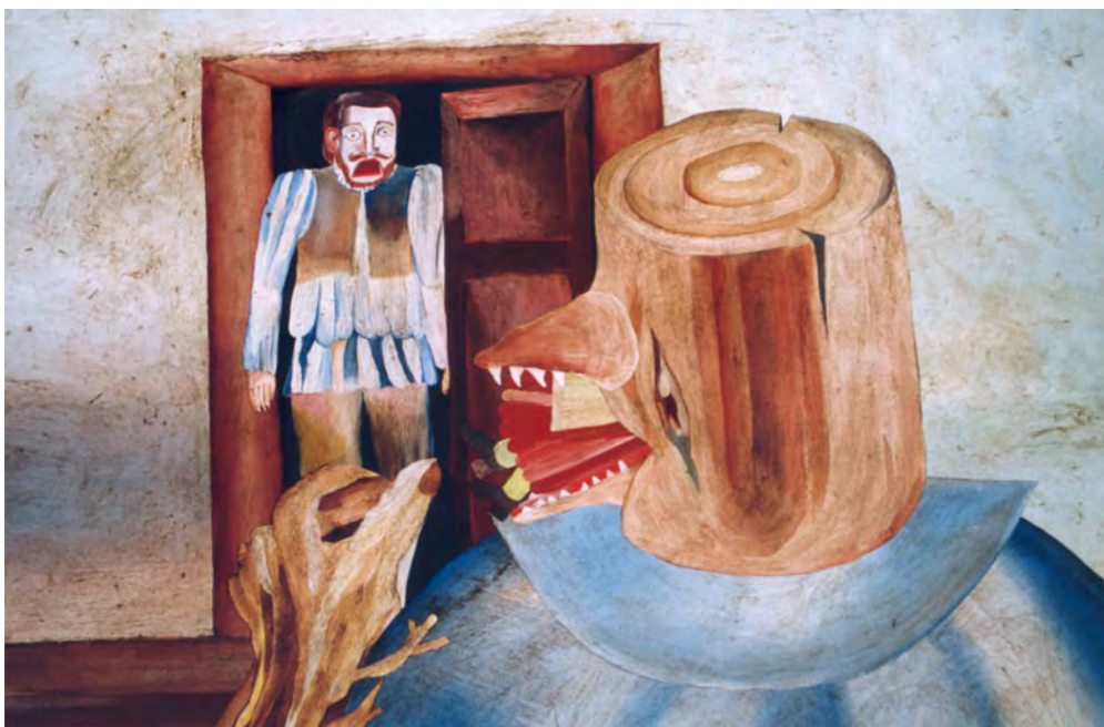
Otesanek © Athenor