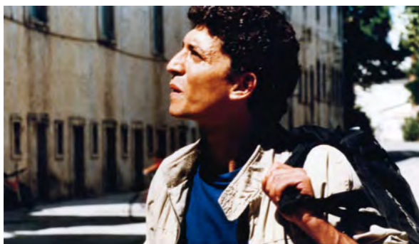
Adieu Gary