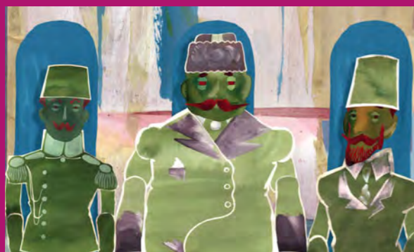
Chiienne d'histoire © Serge Avédikian

Pour tous ceux qui continuent d'aimer le cinéma quand ils sont devenus parents. Séances bimensuelles, le mardi après-midi, réservées, une fois n'est pas coutume, aux adultes accompagnés d'un nourrisson de moins de dix mois. Lumière tamisée, son adouci, tout est fait pour ne pas perturber les plus petits. Avec une programmation liée à l'actualité des cycles, festivals et collections du Forum des images. Un matériel de nursery est également mis à la disposition des parents qui n'entendent pas renoncer au cinéma... Première séance de la saison, mardi 21 septembre à 14h00 : Ma femme est une actrice d'Yvan Attal, avec Charlotte Gainsbourg. Suivent Piter FM d'Oxana Bychkova le 5 octobre, À bout de souffle de Jean-Luc Godard le 19 octobre, Pour rire de Lucas Belvaux le 16 novembre, Haute pègre d'Ernst Lubitsch le 30 novembre.