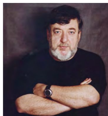
Pavel Louguine