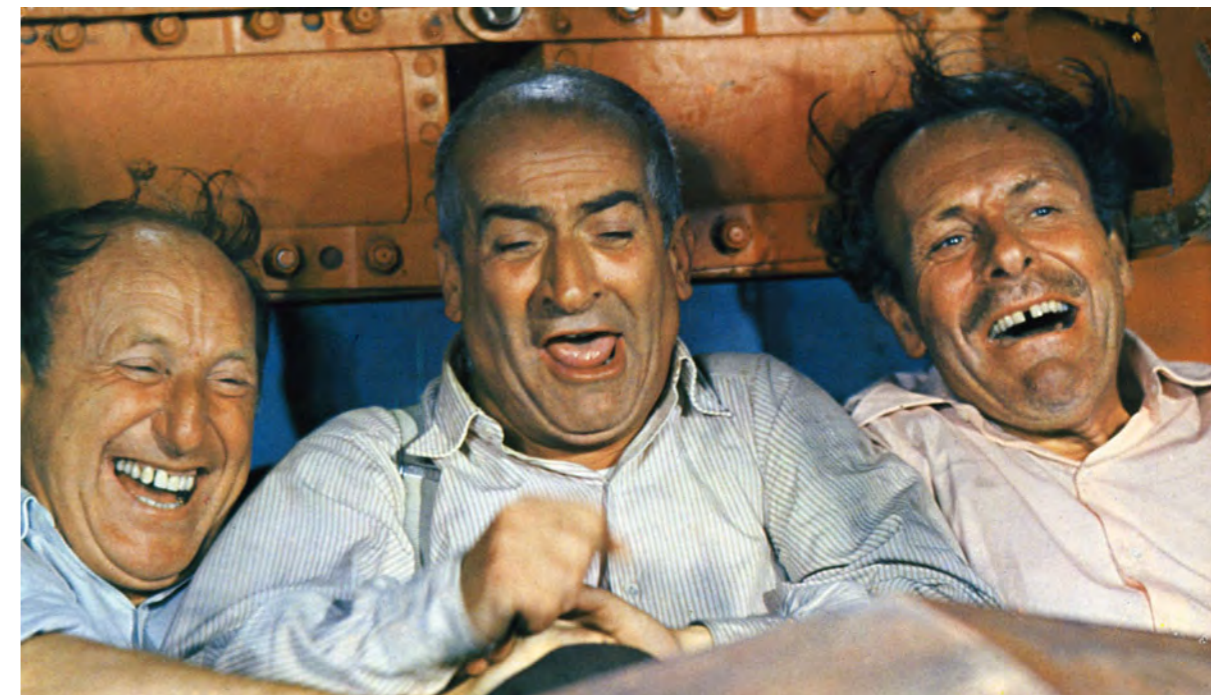
La Grande Vadrouille