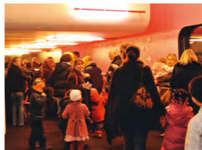
Tout-Petits Cinéma

Fort du succès des trois premières éditions, Tout-Petits Cinéma revient pour la quatrième fois, avec davantage de projections, ciné-concerts, performances, spectacles, animations interactives, ateliers... Car ce festival, ouvert sur la création cinématographique passée ou récente, fait aussi la part belle aux spectacles vivants. Spécialement adaptées à la capacité d'attention et de concentration des plus petits, les séances sont de courte durée, festives, et pour la plupart accompagnées d'interventions d'artistes de la scène : musiciens, marionnettistes, conteurs, chanteurs, performeurs... Tout est expliqué, montré, précisé, afin que les enfants ne soient pas surpris de la lumière qui s'éteint, de l'image sur grand écran, de la taille de la salle, et qu'ils vivent pleinement cette expérience partagée avec d'autres. Une occasion unique de les initier, en douceur et avec des programmes de qualité, aux joies du cinéma.