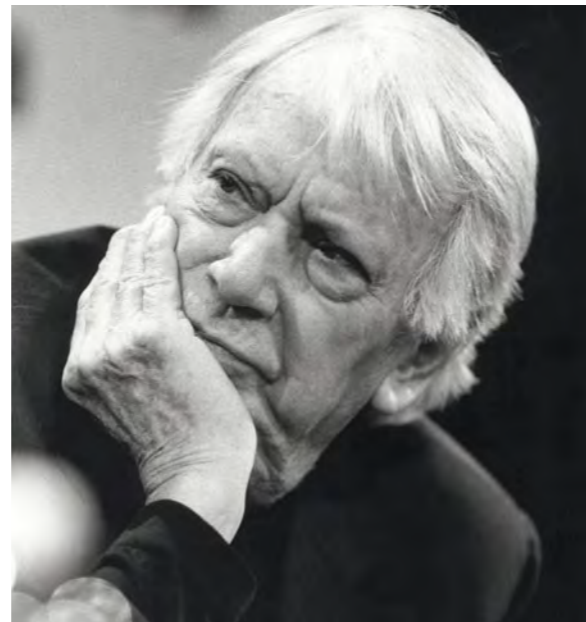
Jorge Semprun

Huit films et une table ronde pour sonder le regard de cinéastes d'un même pays sur leur environnement politique. À l'honneur cette année, le cinéma mexicain et la façon dont il aborde le thème des flux migratoires. En 2009, le jeune cinéma politique italien avait été mis à l'honneur à l'occasion de la sortie de Gomorra , ainsi que, en 2010, le cinéma coréen et la question de l'identité coréenne.