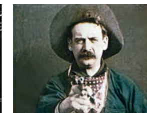
L'Attaque du grand rapide