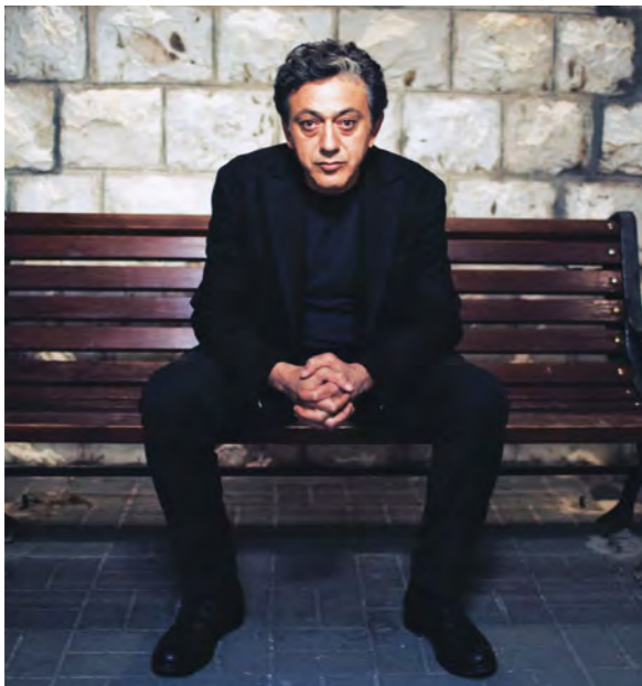
Elia Suleiman