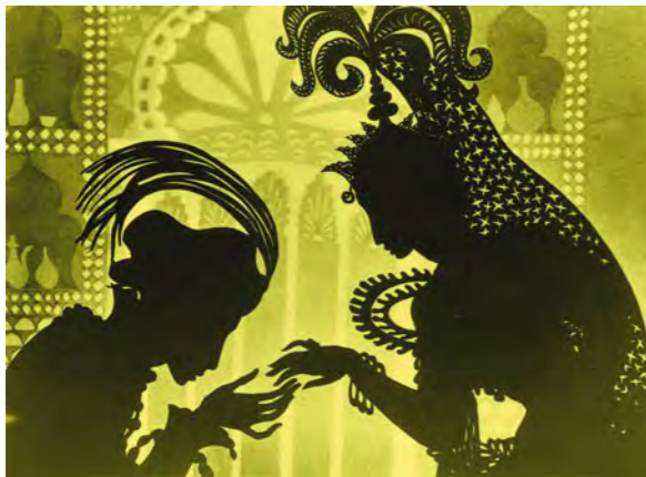
Les Aventures du prince Ahmed

Les Après-midi des enfants s'adressent aux spectateurs de 18 mois à 12 ans. Un film, un débat, des jeux multimédias, un goûter : la formule a conquis petits et grands.