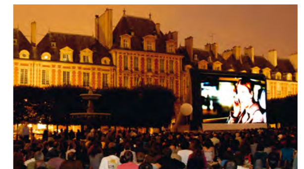
Cinéma au Clair de Lune