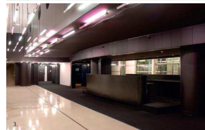
1. Espace de réception du Hall d'accueil 2. La signalétique signée Pierre Di Sciullo 3. Espace de réception du Foyer 500