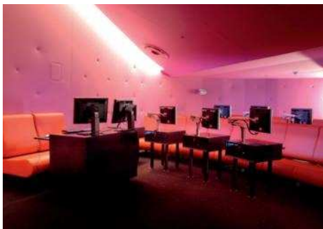
Le Petit Amphithéâtre

Dédiée à la consultation de documents numériques, la Salle des collections offre un confort optimum grâce à son ergonomie, son isolation sonore et son architecture. Ses postes informatiques peuvent être utilisés seul ou à deux, ses deux Petits Salons peuvent être privatisés, son Petit Amphithéâtre peut accueillir jusqu'à 32 personnes sur 16 postes. Sessions de formation, visionnage, ateliers..., notre service commercial est à votre disposition pour étudier tout projet.