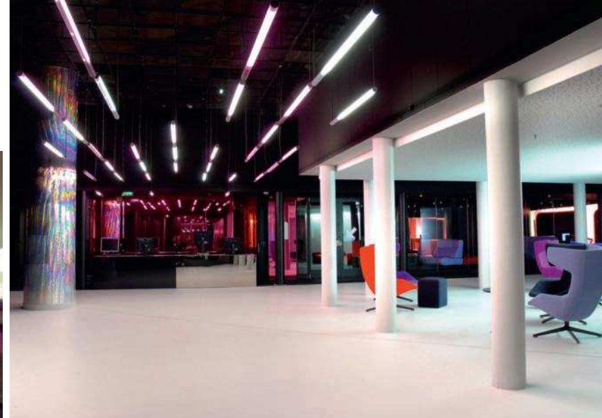
Le Grand Foyer