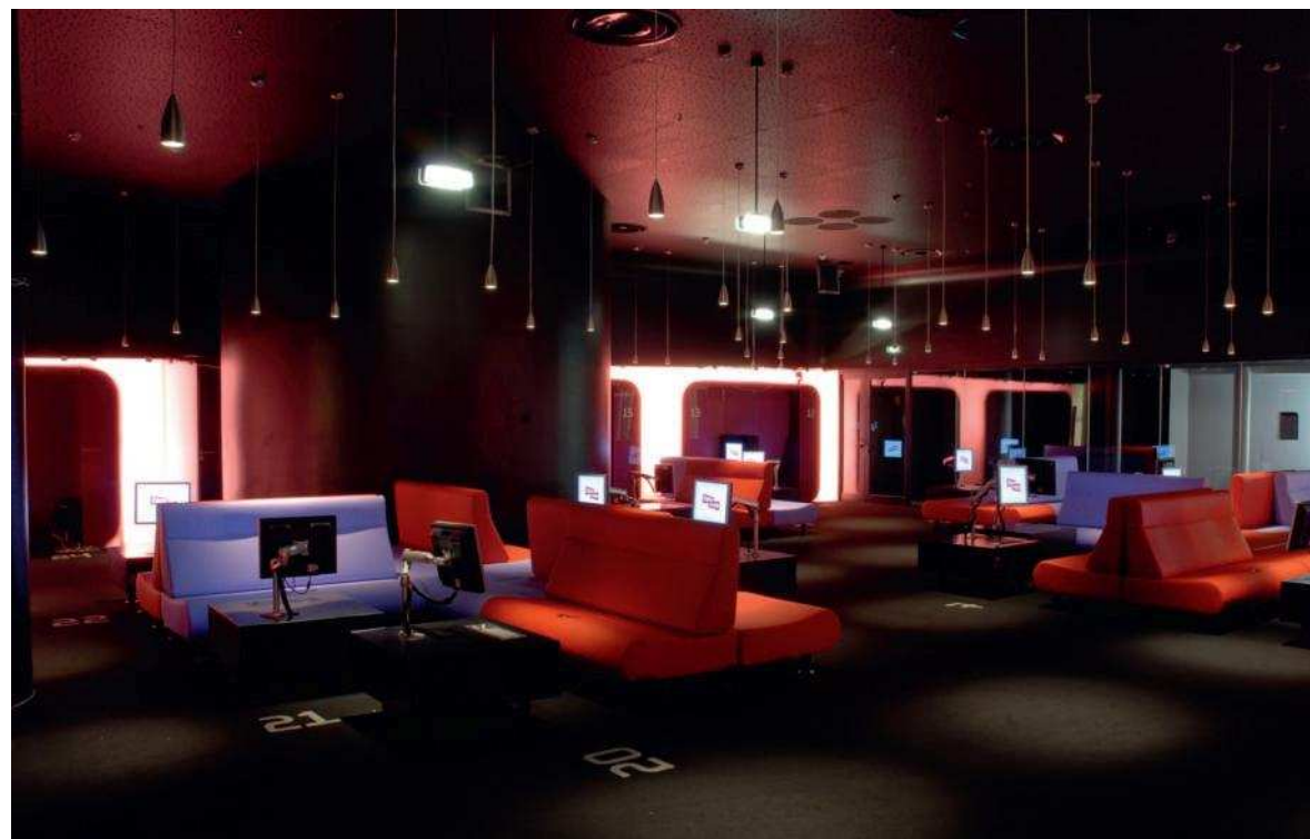
La Salle des collections