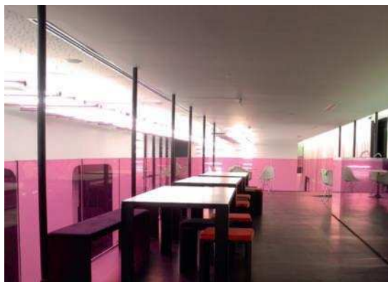
Le 7 e Bar